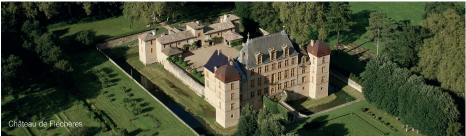
Château de Fléchères

🕒 Ouvert toute l'année, visites guidées conduites par les membres de l'Association « Les Amis du Patrimoine d'Amberieux-en-Dombes » sur réservation à partir de 8 personnes. Pour toute demande groupe, contactez Martine : m.paquier@ars-trevoux.com Durée : 30 à 45 mins