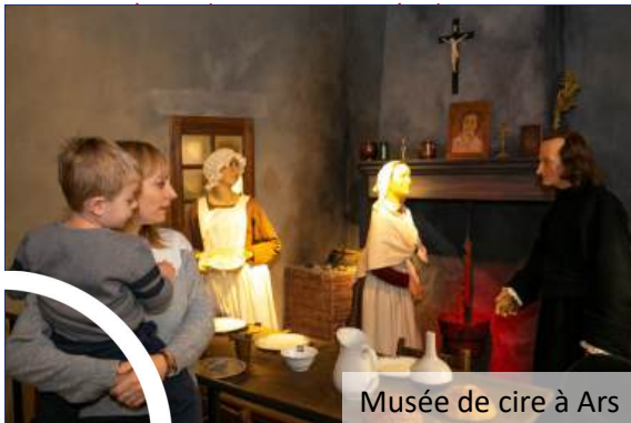
Musée de cire à Ars