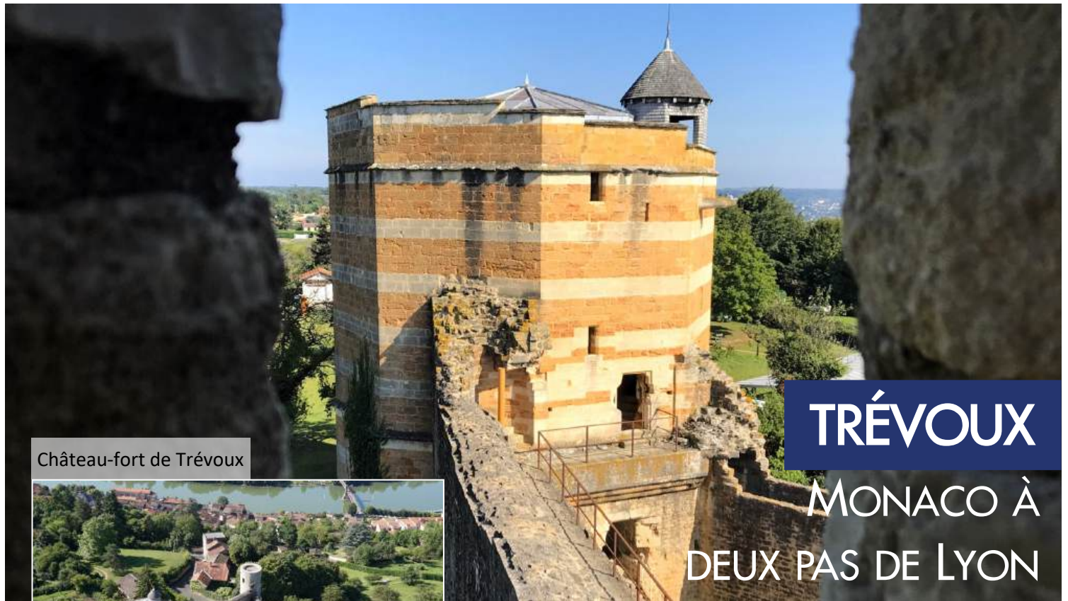
Château-fort de Trévoux