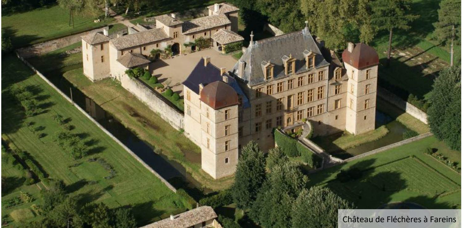
Château de Fléchères à Fareins