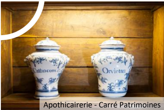
Apothicairerie - Carré Patrimoines