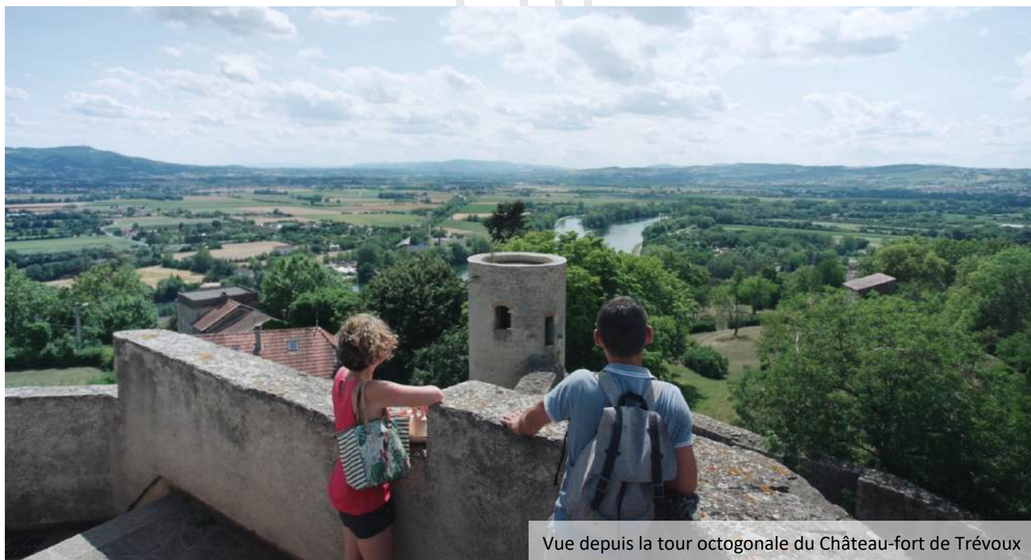
Vue depuis la tour octogonale du Château-fort de Trévoux

Amateurs de grand air, passionnés d'histoires, et amoureux de bonnes tables, des belles surprises vous attendent !