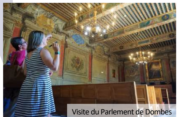
Visite du Parlement de Dombes

Visites possibles du Château de Fléchères du d'avril à mi-novembre. *Prix valable à partir de 15 personnes, hors week-ends et jours fériés, valable selon le restaurant choisi auprès de l'Office de Tourisme.