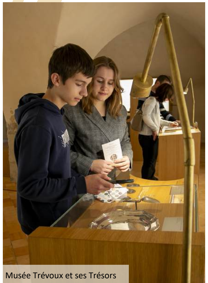
Musée Trévoux et ses Trésors

Faites une halte aux 17ème et 18ème siècles en visitant la salle d'audience du Parlement de Dombes aux décors peints exceptionnels et l' Apothicaierie . Découvrez les collections de monnaie et d'orfèvrerie, la filière en diamant, le Dictionnaire de Trévoux et le rouet à guimper, à travers une visite ludique et moderne au sein du musée Trévoux et ses Trésors . Concluez votre journée par une rencontre avec des Tireurs d'Or tous droits sortis du 18ème siècle.