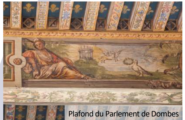
Plafond du Parlement de Dombes